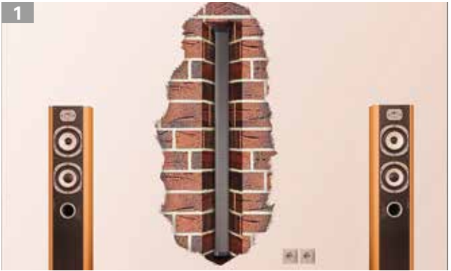
Multimedia-Rohr in der Wand montiert