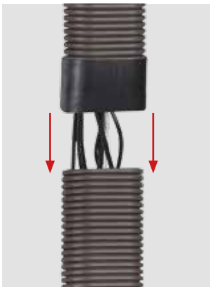
Montage mit Steckverbindung

Das Multimedia-Rohr im 1,5 -m-Set wird mit zwei Auslassdosen und zwei Endkappen geliefert. Das 3-m-Set enthält zusätzlich ein 1,5 m Rohr und eine Steckmuffe. Das 3-m-Set eignet sich besonders für die Verwendung in Besprechungsräumen und öffentlichen Einrichtungen, wie Schulen und Krankenhäusern.