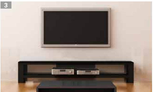
„Kabellose“ Installation mit dem Multimedia-Rohr