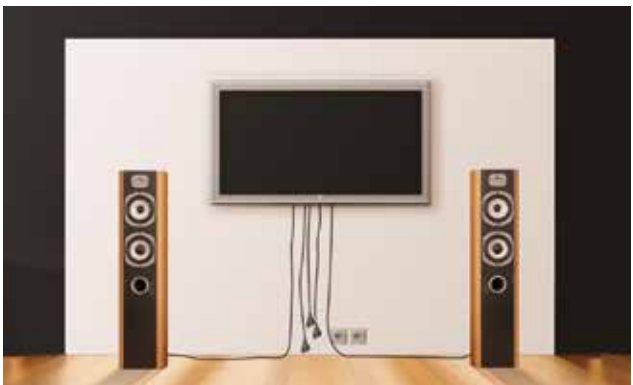
Bisherige Installation ohne Multimedia-Rohr