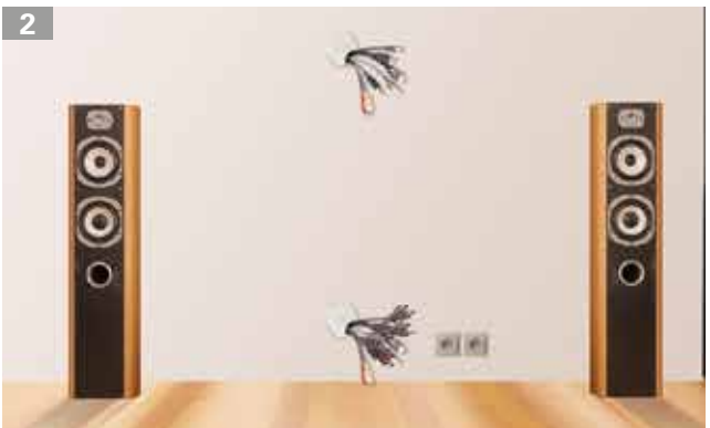
Verlegte Kabel unter Putz