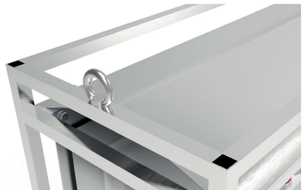
Einfacher Transport mit Hilfe der montierten Kranösen.

Bals Elektrotechnik GmbH & Co. KG D-57399 Kirchhundem-Albaum Telefon: +49 27 23/771-0 Fax: +49 27 23/771-177/178 E-mail: info@bals.com Internet: www.bals.com